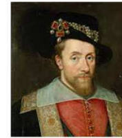
King James I

Guy Fawkes voulait remplacer le roi, protestant, par sa fille de 9 ans, qui pourrait être élevée dans la foi catholique.